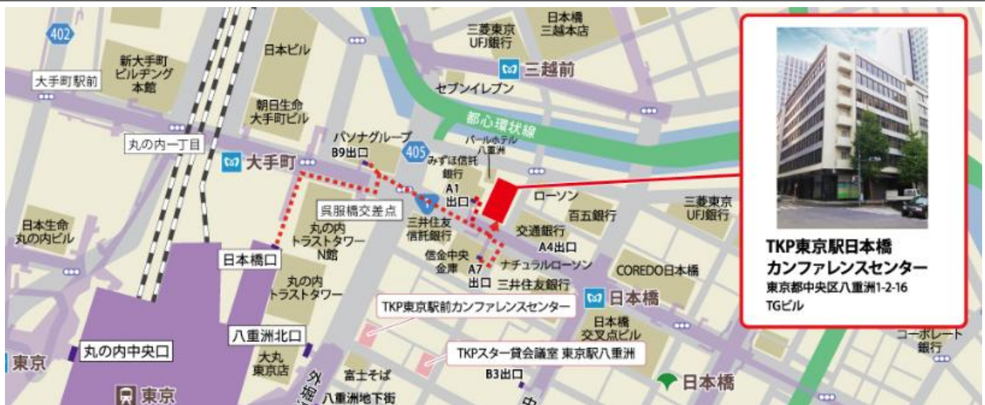
TKP東京駅日本橋 カンファレンスセンター 東京都中央区八重洲1-2-16 TGビル