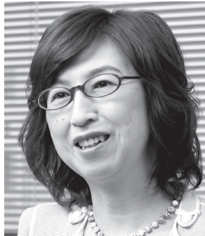
南場 智子氏 DeNA取締役会長・創業者

1986年、マッキンゼー・アンド・カンパニーに入社。1990年、ハーバード・ビジネス・スクールにてMBAを取得し、1996年、マッキンゼーでパートナー（役員）に就任。1999年に同社を退社して株式会社ディー・エヌ・エーを設立、代表取締役社長に就任。2015年6月、取締役会長就任（現任）。2013年、初の自著となる『不格好経営—チームDeNAの挑戦』（日本経済新聞出版社）を出版。