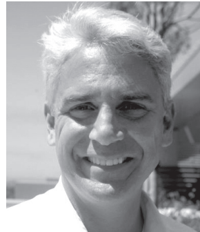
Errol Arkilic氏 M34 Capital, NSF I-Corps program設立メンバー

1986年、マッキンゼー・アンド・カンパニーに入社。1990年、ハーバード・ビジネス・スクールにてMBAを取得し、1996年、マッキンゼーでパートナー（役員）に就任。1999年に同社を退社して株式会社ディー・エヌ・エーを設立、代表取締役社長に就任。2015年6月、取締役会長就任（現任）。2013年、初の自著となる『不格好経営—チームDeNAの挑戦』（日本経済新聞出版社）を出版。